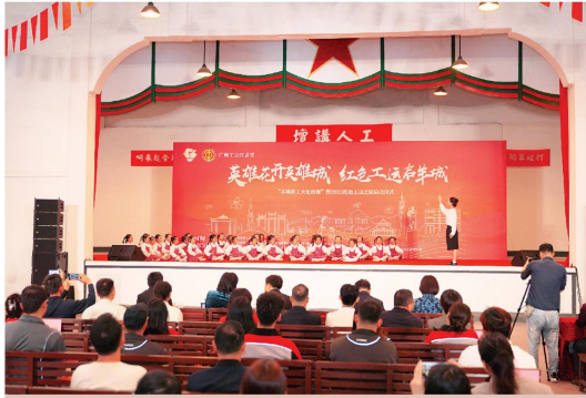
昨日，“英雄花开英雄城 红色工运启羊城”羊城职工大团游暨2025红色工运之春第一次全国劳模大会旧址正式启动仪式在海珠区红棉小学举办的《少年有梦》拉开序幕。