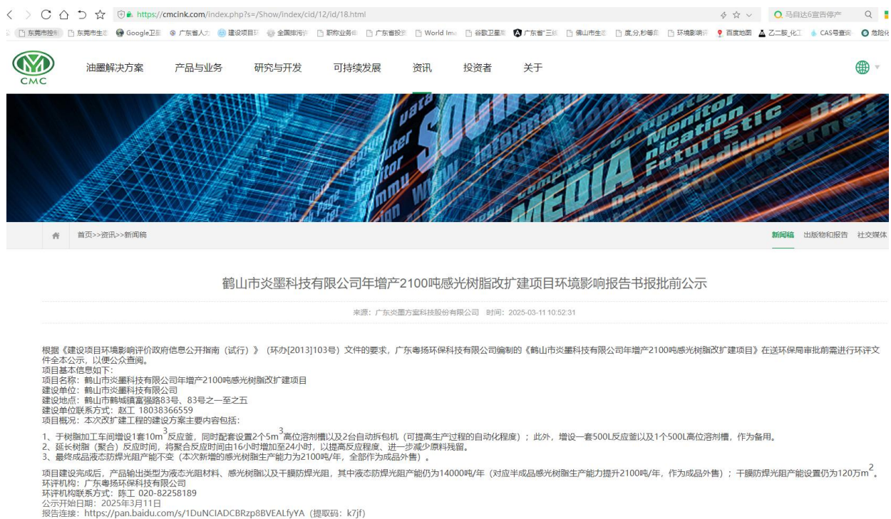
图 6.2-1 鹤山市炎墨科技有限公司年增产 2100 吨感光树脂改扩建项目环境影响报告书报批前公示（网络）

选择在环评单位鹤山市炎墨科技有限公司官方网站上公示（公示网址为： https://cmcink.com/index.php?s=/Show/index/cid/12/id/18.html ）。