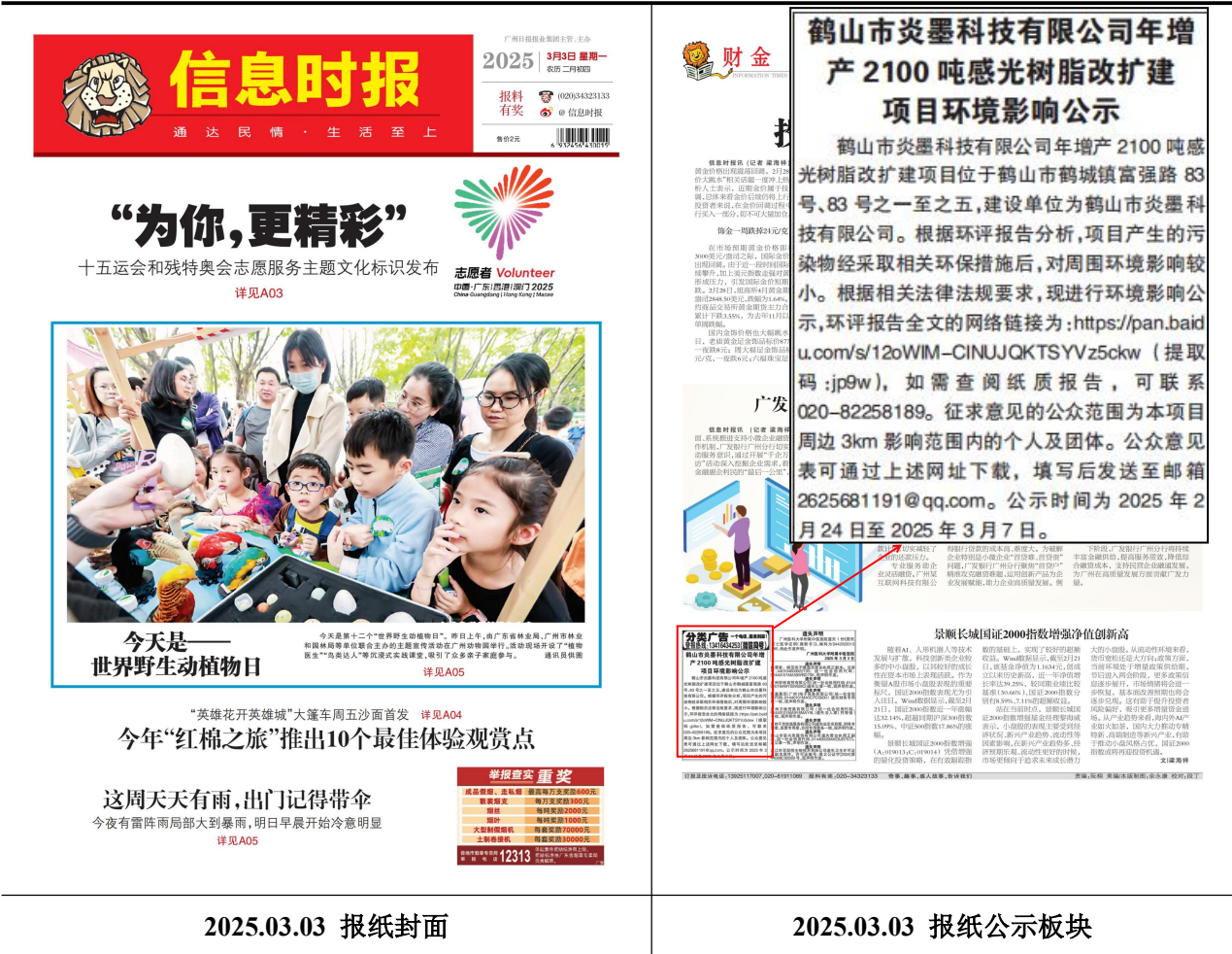
表 3.2-1 报纸公示截图

报纸公示选择《信息时报》进行公示，符合相关要求。报纸公示于公示期间，分别于2025年3月3日、2025年3月4日登报公示，公示照片见表3.2-1：