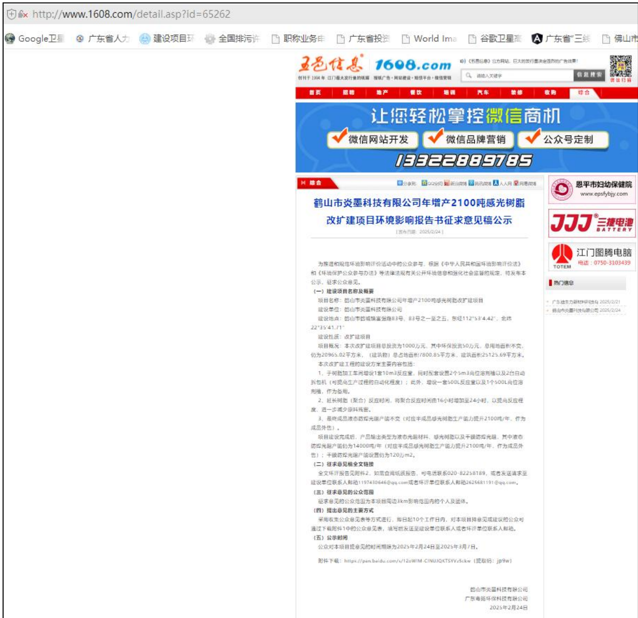
图 3.2-1 网络公示截图