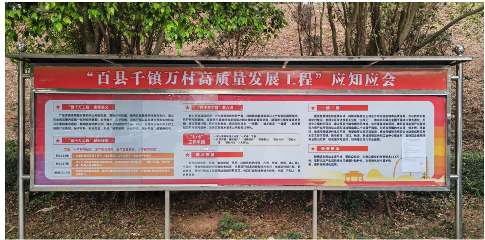
鹤山工业城内管委会-远景