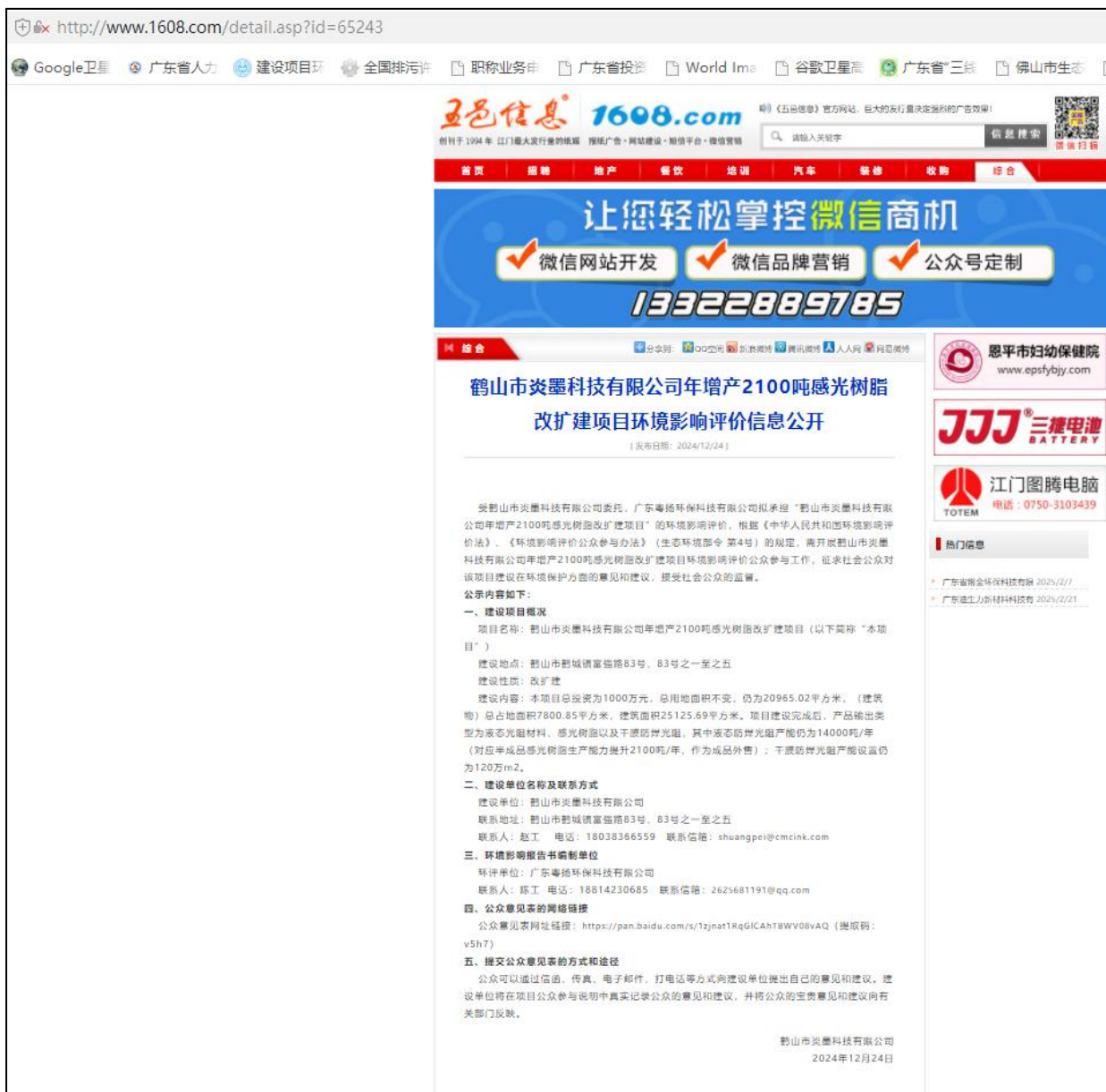
图 2.1-1 第一次网上公示截图